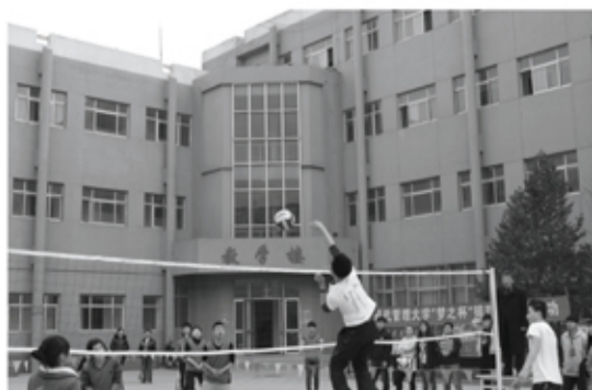
第二届“梦之杯”排球赛圆满举行