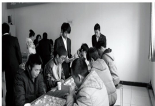
第二届“梦之杯”象棋比赛