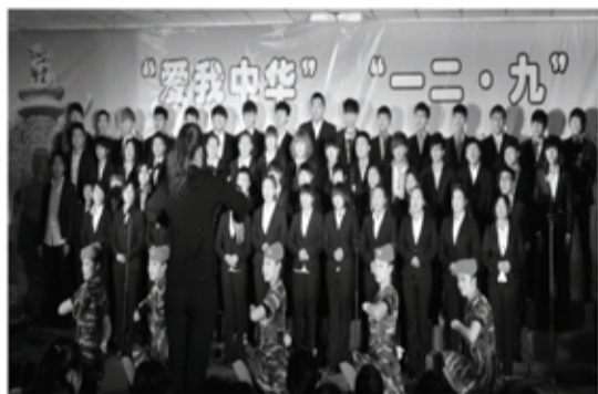
一二·九歌咏诗歌会第三名