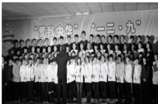
一二·九歌咏诗歌会优秀奖