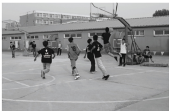
第二届“和谐杯”篮球赛圆满举行