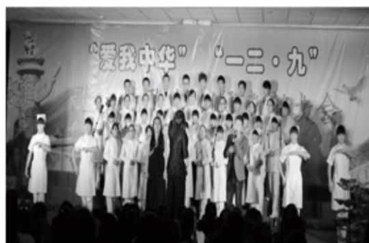
一二·九歌咏诗歌会第二名