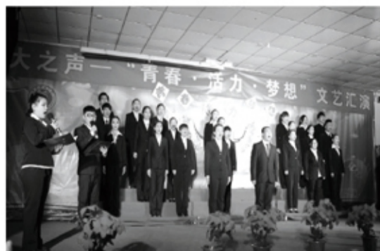
现大之声——青春·活力·梦想文艺汇演