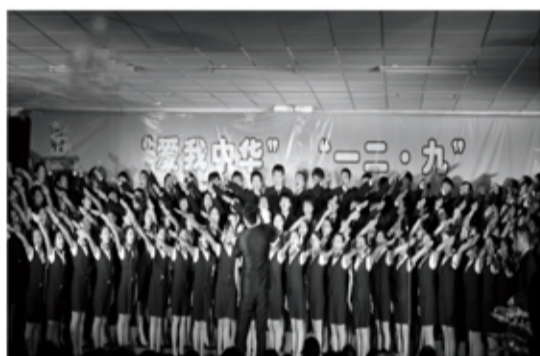
一二·九歌咏诗歌会第一名