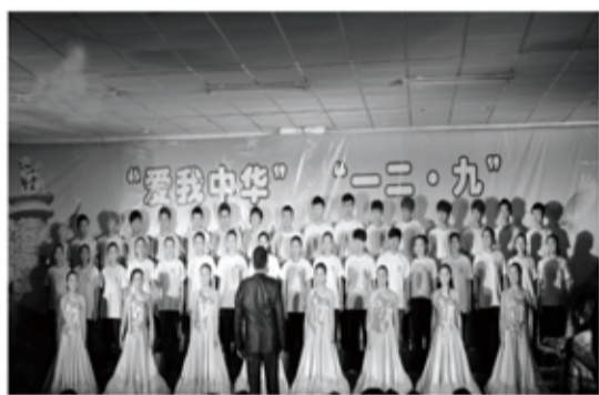
一二·九歌咏诗歌会特别奖