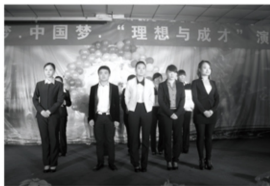
我的梦·现大梦·中国梦“理想与成才”演讲比赛