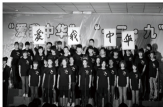
一二·九歌咏诗歌会最佳组织奖